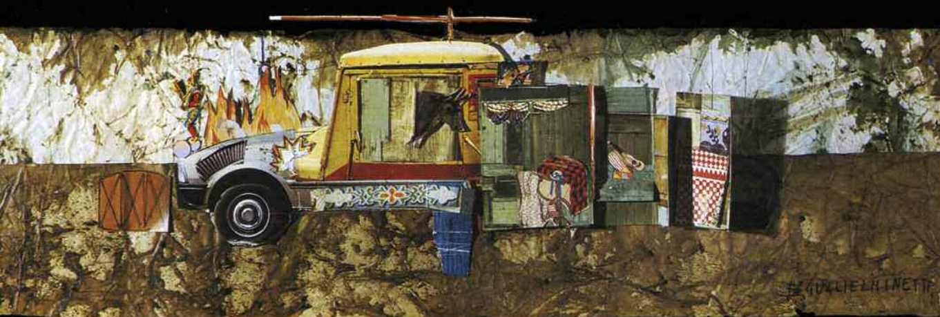
illustrazione: Eugenio Guglielminetti progetto grafico: Maurizio Agostinetti

testo e regia: Luciano Nattino musiche originali: Paolo Conte scene: Eugenio Guglielminetti