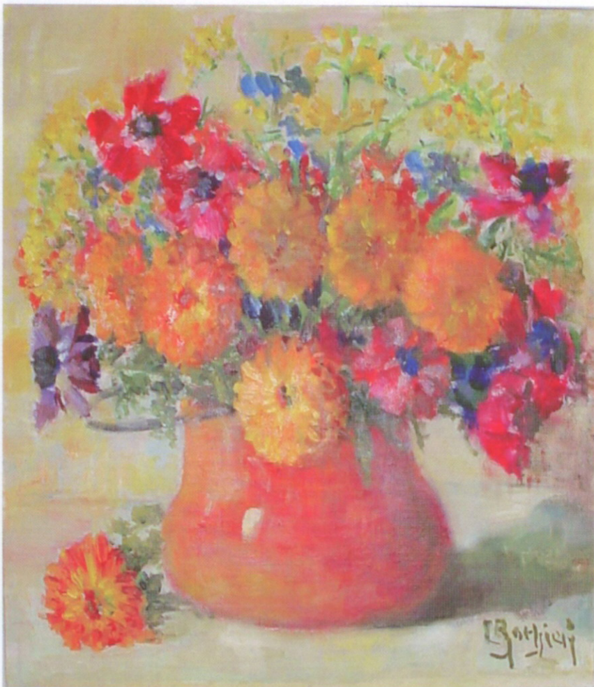
Erminia Barbieri Il rosso del vaso, 1975 ca. Olio su cartone telato, cm 40x 35

Allestire una mostra della pittrice ERMINIA BARBIERI (Sannazzaro de' Burgondi 1890 – 1981) è un compito facile solo in apparenza. E' un'arte, la sua, assolutamente figurativa e con caratteristiche di ripetitività (i soggetti sono nature morte e vasi di fiori recisi) che sono fuorvianti per la valutazione del lavoro sulla materia pittorica, intenso e fortemente impregnato di una forte sostanza di cultura e di sentimento. Barbieri è stata un'artista capace di tradurre la sua vita interiore nei segni lasciati dai suoi tracciati di pennello e negli amalgami dei suoi colori. Per questa esposizione, è stato scelto di escludere molti dipinti belli, ma fatti con un ricordo privilegiato verso il suo ultimo maestro, il raffinato pittore Augusto Bucik (Trieste 1887 – 1951) che l'aveva educata ad un'arte sapientissima e molto attenta alla bellezza formale. Sono stati invece selezionati dipinti che stanno nel periodo più alto dell'arte della Barbieri, quando il suo materiale pittorico, sempre controllato nella forma, si esprime tuttavia sulle tele vibrando fra le ansie, i ricordi e gli abbandoni, ma anche rincorrendo i sorrisi e le piccole felicità, della sua intimità di donna. Uno splendido diario quotidiano che, a trent'anni dalla morte dell'artista, noi godiamo come una pittura che vive di se stessa, non ha età ed è senza tempo.