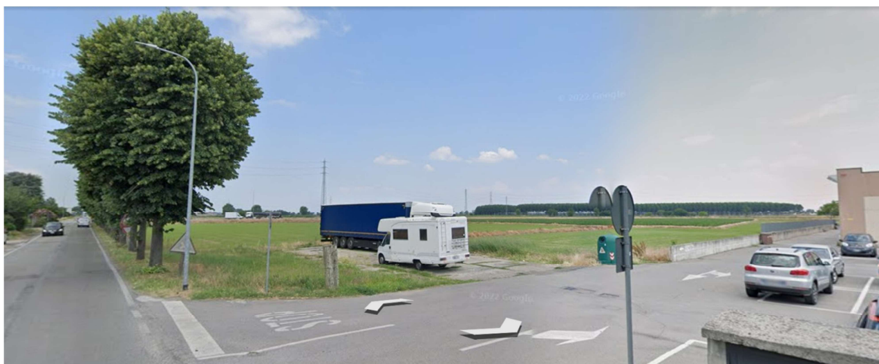
Vista n° 1 - Vista da Viale Loreto