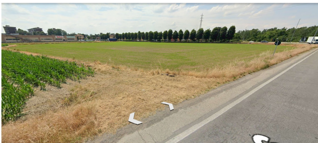
Vista n°3 - Vista da Via de Gasperi (S.P. 206)