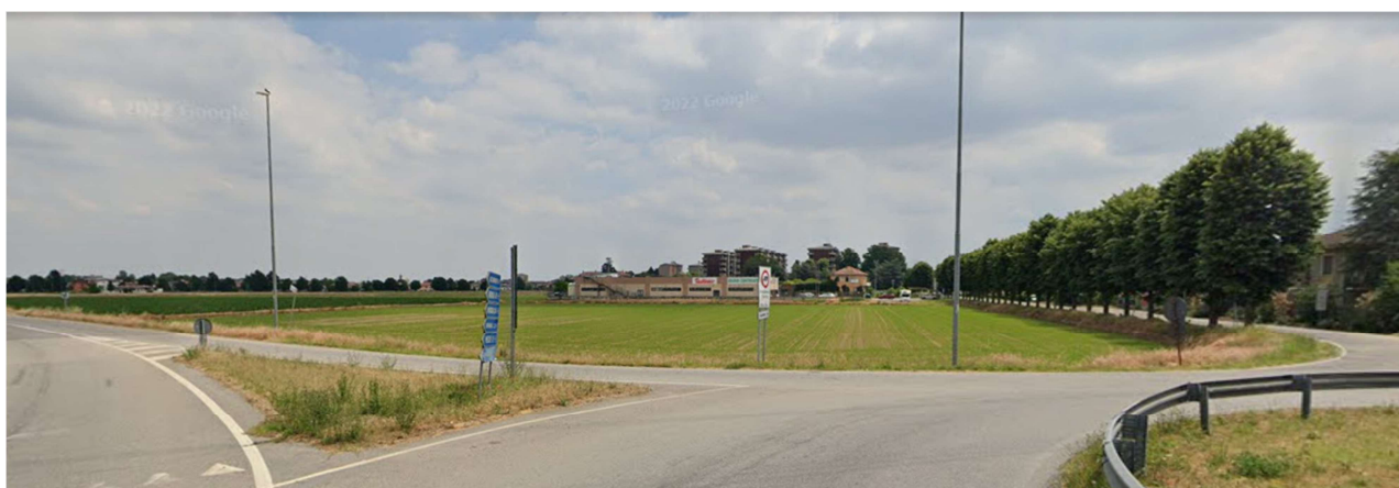
Vista n°2 - Vista dalla rotonda tra Viale Loreto e Via de Gasperi (S.P. 206)